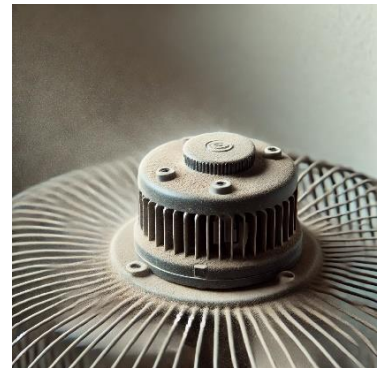
Figure 5: 埃が堆積した扇風機

東南アジアでは扇風機を使用している場面が多く見受けられます。扇風機は周囲から埃を集めやすく、モーター付近に蓄積した場合に負荷がかかり過熱の原因となります。モーターの熱は配線を劣化させて短絡の原因にもなるため、定期的な清掃によって短絡リスクを減らすことが重要です。また、長時間の使用による熱の蓄積を防ぐため、複数台の扇風機を交代で稼働させることも重要です。また、扇風機の耐用年数は一般的に 10 年前後であるため、耐用年数に近い年数が経過した場合には、異常がないかチェックして必要に応じて交換や修理をお勧めします。